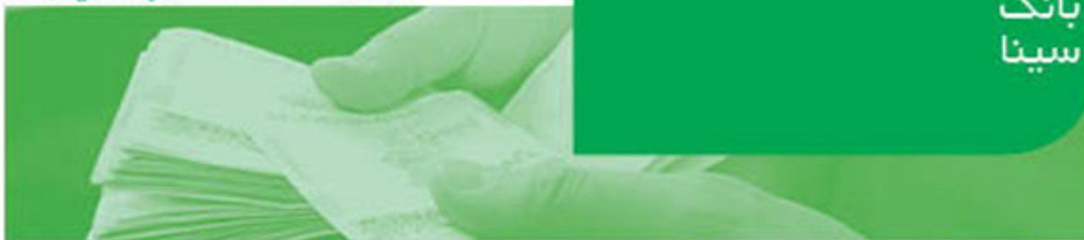
یادداشت‌های توضیحی صورت‌های مالی سال مالی منتهی به ۲۹ اسفندماه ۱۳۹۰