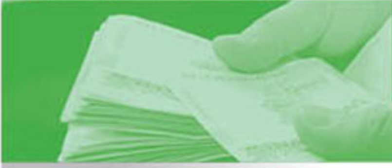
یادداشت‌های توضیحی صورت‌های مالی سال مالی منتهی به ۲۹ اسفندماه ۱۳۹۰

۱-۹-۱- ماهیت هر درآمد شرکت برای کلیه سالهای قبل از ۱۳۸۷ قطعی و تسویه شده است و خلاصه وضعیت ماهیت‌پرداختی برای سالهای ۱۳۸۷ تا ۱۳۹۰ به شرح جدول زیر است: